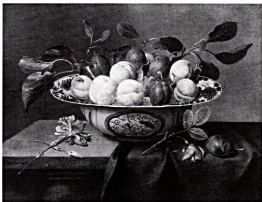
Afb. 78A J. van Hulsdonck, paneel, 30 x 39,5 cm., gem. Kunsth. R. Koetsier, Londen, 1967

De Gheyns bloemstukken zijn echter anders van karakter: de bloemkelken staan bij hem nooit ver uit elkaar, zoals op ons stuk, maar vormen één kleurige massa. 1 Het nadrukkelijk plastische modelé van ons stuk deed mij aan het werk van Van Hulsdonck denken, die vooral door zijn manden of schalen vruchten in horizontaal formaat bekend is. Daarop bleken dezelfde leer-achtige bladeren voor te komen als rechts op ons stilleven. 2 Nader onderzoek wijst uit dat het stuk inderdaad van deze meester moet zijn. Dezelfde anjer, op dezelfde wijze als 'sluitstuk' links onder gebruikt, komt voor op een aantal voluit gemerkte fruitstukken van zijn hand. 3 Die anjer net zo, met bovendien, net als op ons stuk, een bloem in de knop kruiselings er onder komt eveneens herhaaldelijk voor (afb. 78A). 4 Een vaas met bloemen komt ook voor naast zo'n fruitmand. 5 Tenslotte werd onlangs een ander 'zuiver' bloemstuk van de meester bekend (afb. 78B). Daarop duikt opnieuw het motief op van de over een bloemknop gekruiste anjer links onder, komt rechts midden dezelfde vlinder voor, en rechts boven dezelfde tulp met open 'luikje' die op ons stuk rechts midden te zien is. De bloemen in de vaas (ditmaal met o.a. rozen aan de tulpen toegevoegd) staan even wijd uiteen, zodat er (als op ons stuk) tussendoor ruim zicht is op de achtergrond (afb. 78B). 6 Het feit dat Hulsdonck ons stuk schilderde, verklaart ook het Antwerpse 'handelsmerk' achterop (verso).