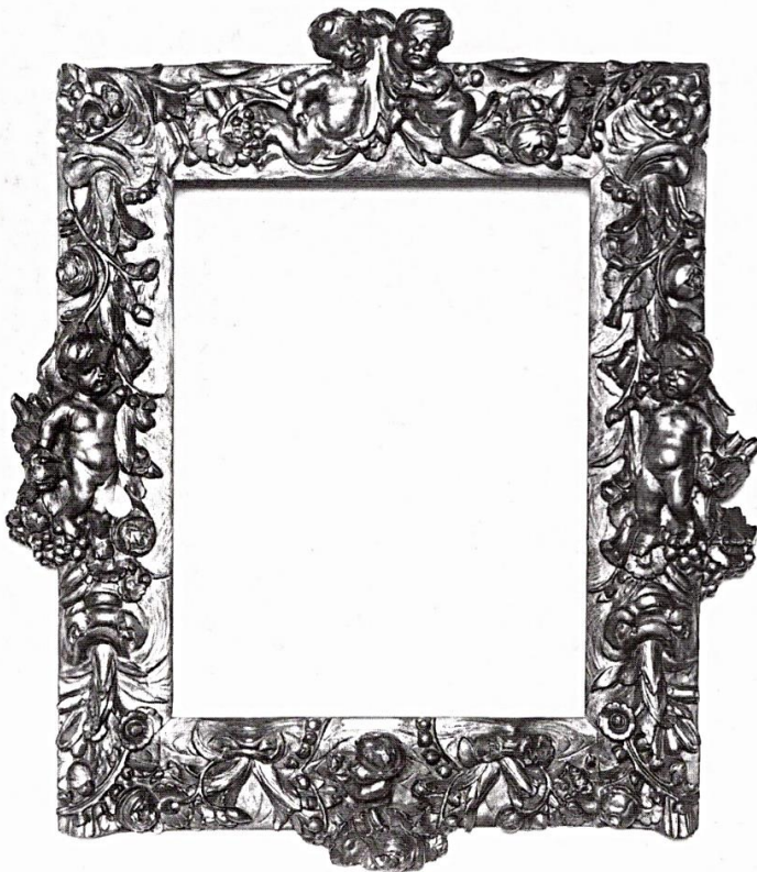
Afb. 82A Lijst van cat. nr. 82