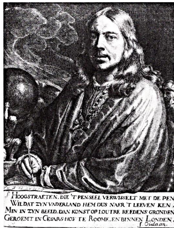
Afb. 74A Samuel van Hoogstraeten, Zelfportret op 50-jarige leeftijd , voor in diens Inleyding... , 1678, ets, gem. en gedat. op het blad papier op tafel: S.V.H. AET. 50. D o . 77