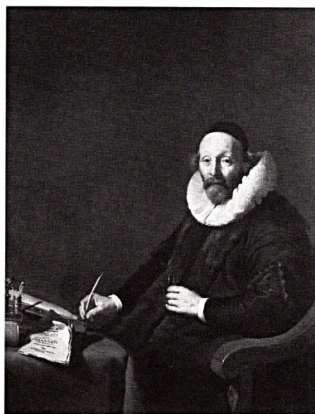
Afb. 5A J. Backer, De predikant J. Uytenbogaert . Doek, 122 x 98 cm. gem. en gedat. 1638. Bruikleen aan Rijksmuseum, Amsterdam