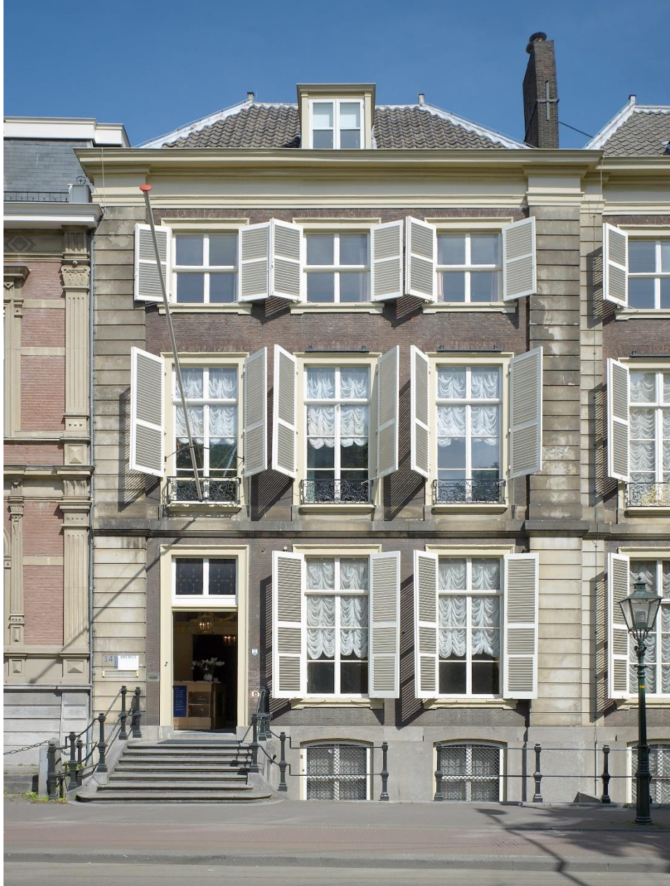
Het pand langeVijverberg 14